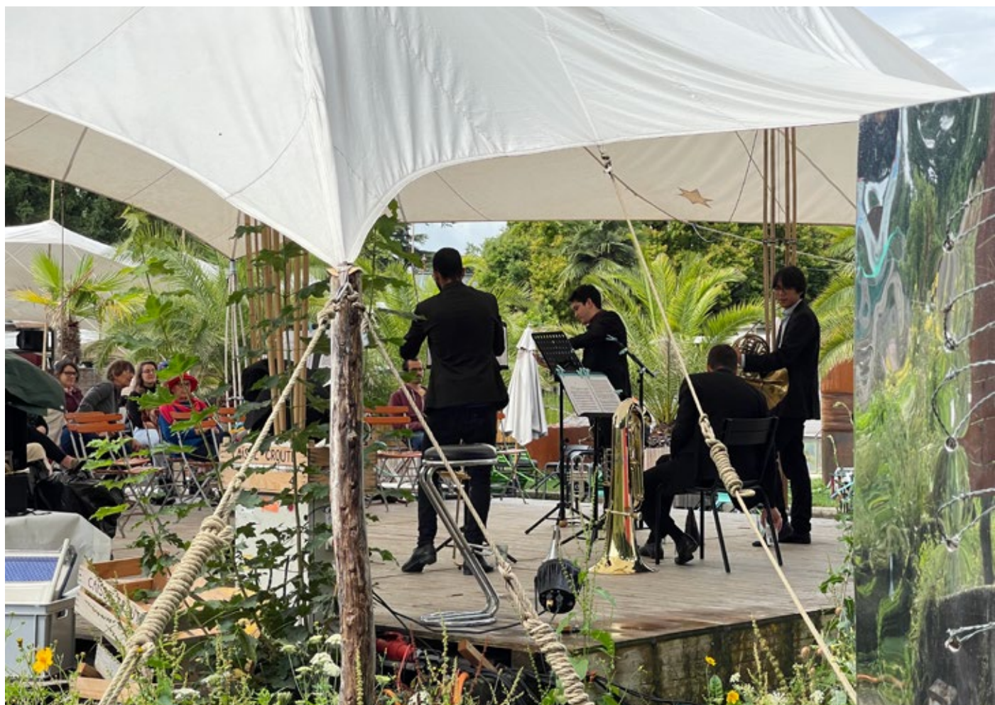
Quintette de cuivres du jet d'eau