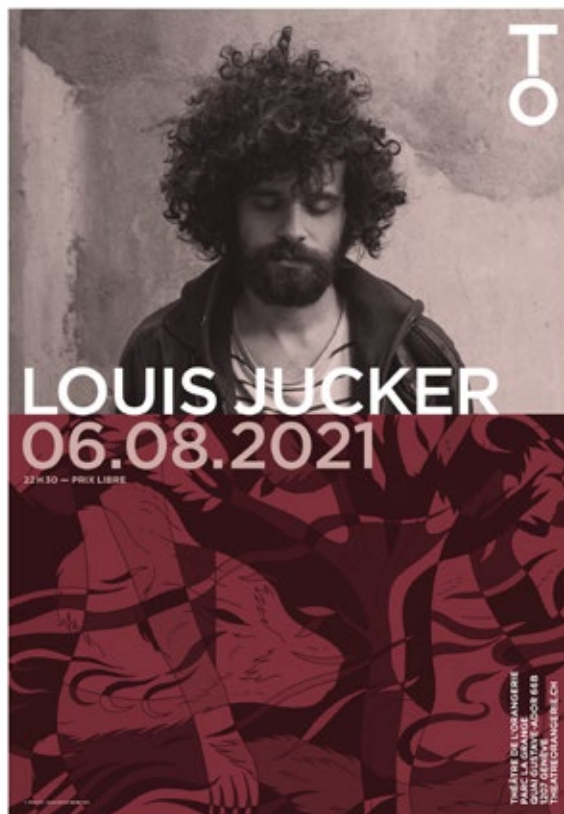
Affiche concert A3