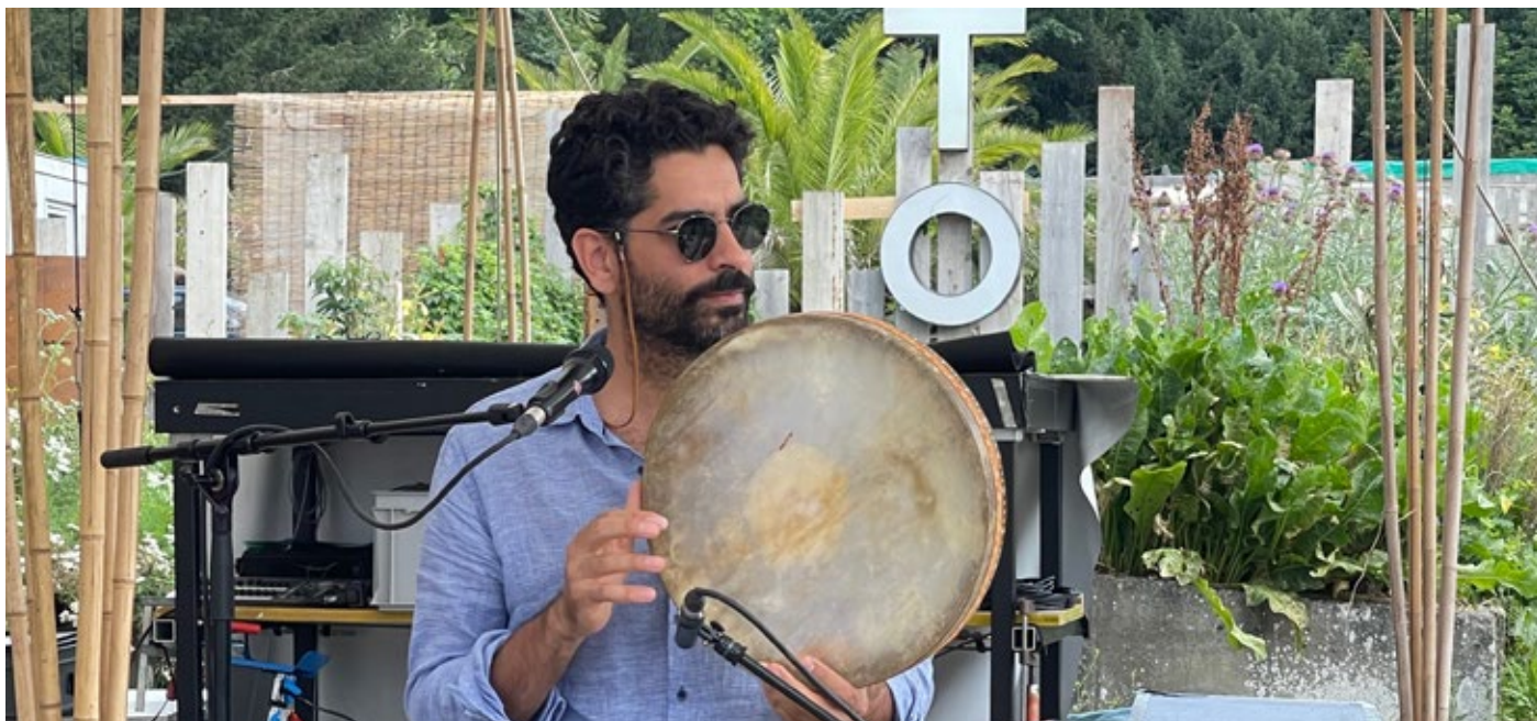
Duo Rokhs