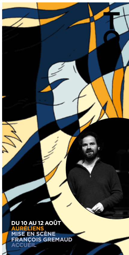
Feuille de salle

En raison de la situation sanitaire encore mouvante de cet été, mais aussi dans une volonté de réduire notre matériel imprimé, nous avons fait le choix d'éditer un programme/calendrier plus concis que les années précédentes, pour le réduire à l'essentiel. Tous les détails de la programmation étaient disponibles sur notre nouveau site internet.