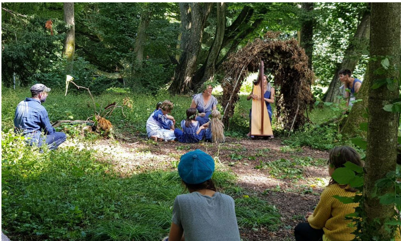
Pieds nus dans la mousse avec mes grandes oreilles

Pour la quatrième année consécutive, le TO a continué sa formule qui a, désormais, fait ses preuves : des spectacles légers, tout terrain, conçus et intégrés dans la nature réelle du parc La Grange.