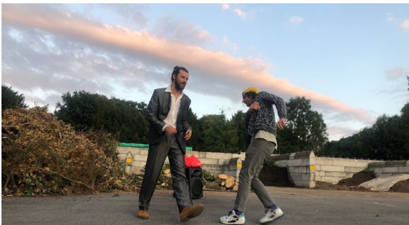
Les Rigoles©Andrea Novikov